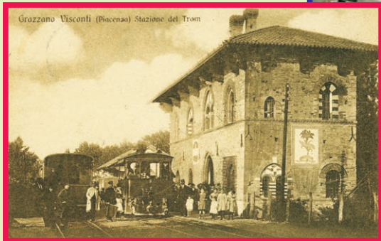
La seconda stazione tramviaria in una foto del 1920