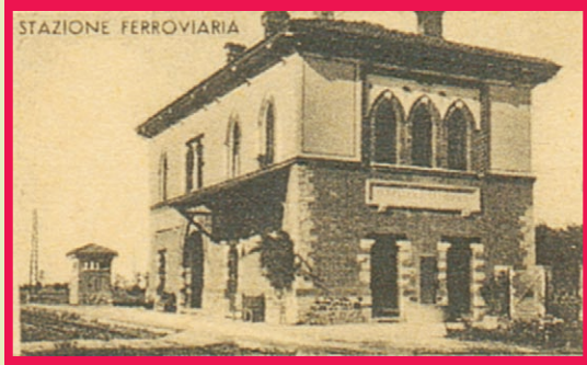
La terza stazione ferroviaria in una foto del 1924